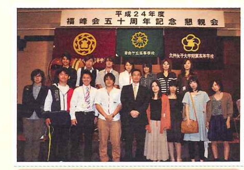
昨年の総会も、代表幹事の方々に手伝っていただきました。