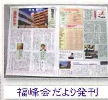
福峰会だより発刊